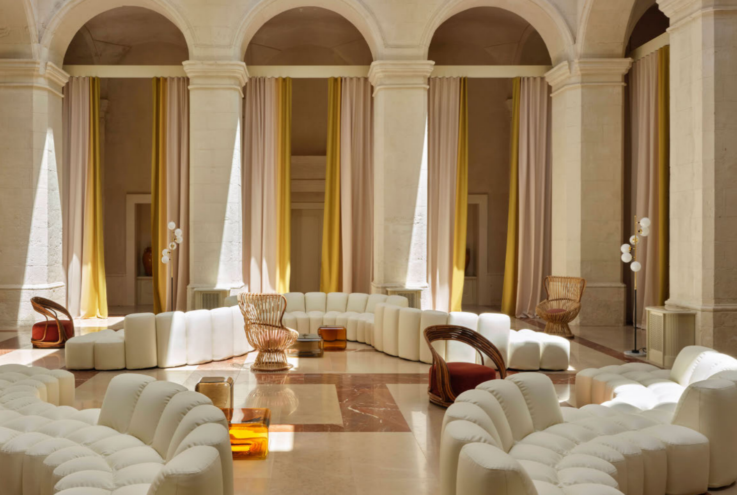
Hotel Vista Ostuni