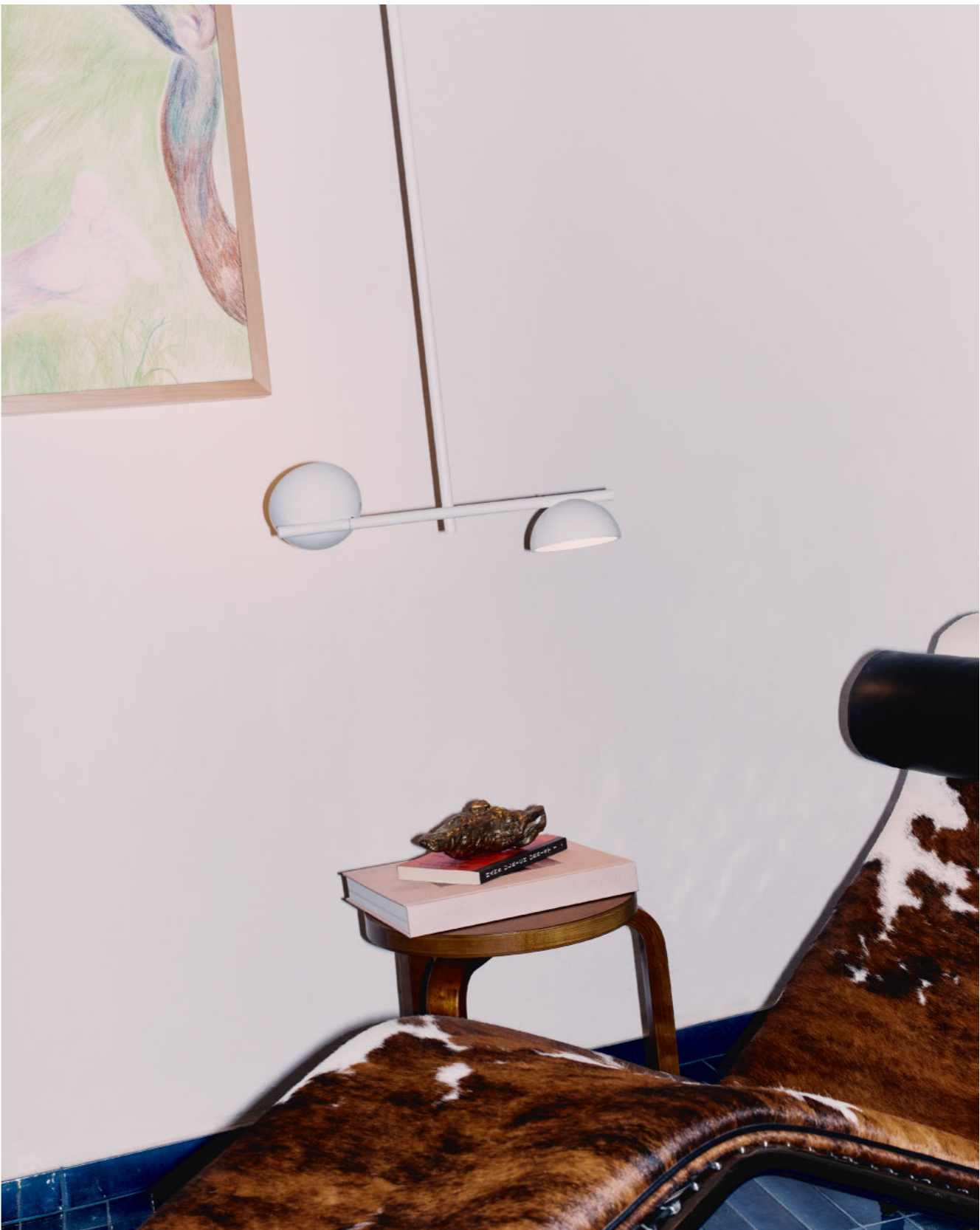
EN Nido originates from a project by Paolo Cappello, who reinterprets in a contemporary key the aesthetic of «cups, arms and joints» that Domus celebrated as a distinctive hallmark of Stilnovo already in the late 1940s. From this inspiration emerges a versatile and complete collection, built around its signature adjustable cup, capable of rotating vertically up to 350 degrees. This freedom of movement allows the light to be modulated intuitively, directing the diffuse illumination downward, toward the ceiling or toward the wall, depending on the needs of the space.