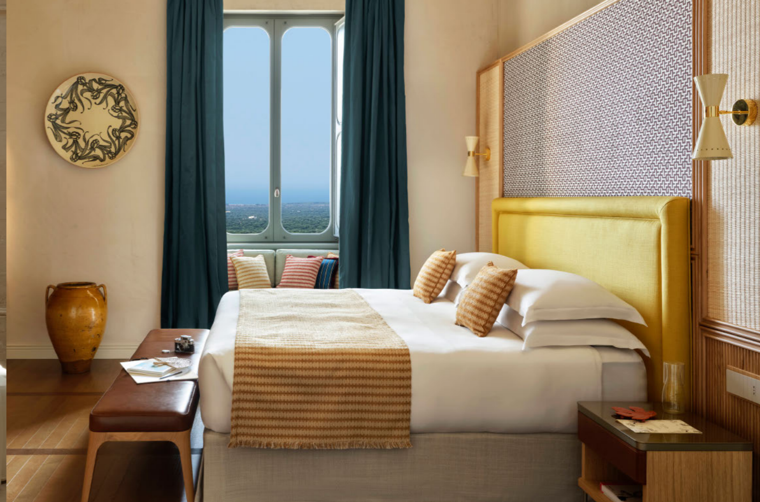
In this project: Galassia and Megafono